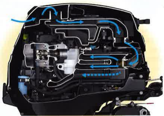
→ Air Flow