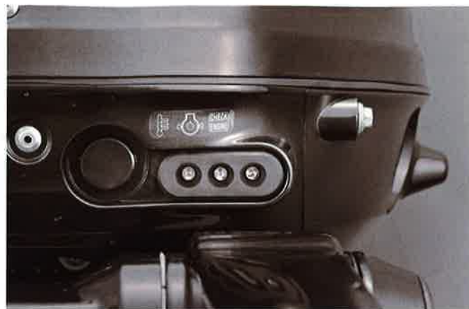
Drei LED's informieren über den Betriebszustand

tung direkt am Motor, nacktes Bootsgewicht gerade mal 94 kg. Eine ungewohnte Konstellation für PS-verwöhnte Test-Schreiberlinge. Und dann noch als Crew zwei gestandenen Mannsbildern. Was soll da schon groß rumkommen?! Umso überraschender hingegen Fazit sowie Resümee: Nach lediglich 2,5 Sekunden jumppte der