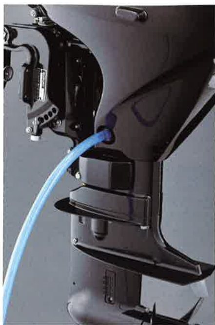
Leicht zugänglicher Spülanschluss für Frischwasser