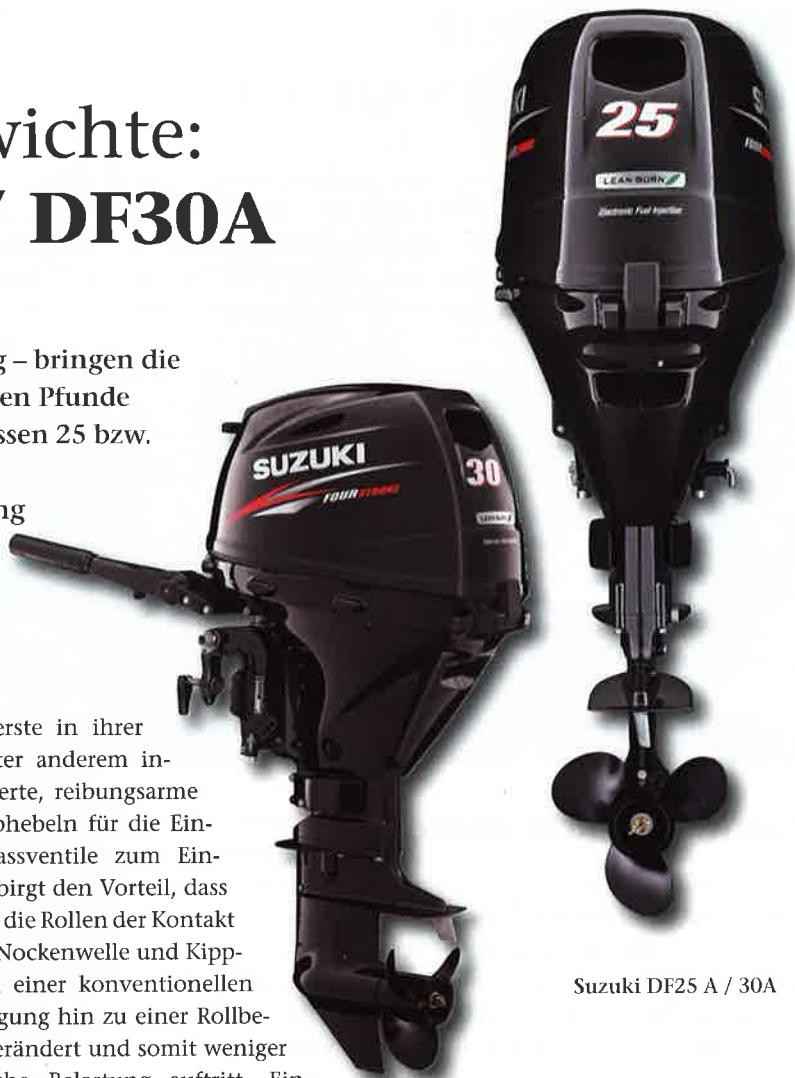
Suzuki DF25 A / 30A

nischen Wirkungsgrad. Ein simples, dennoch nicht weniger effizientes Konstruktionsmerkmal. Durch diese Bauweise wird