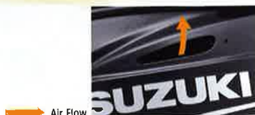
→ Air Flow